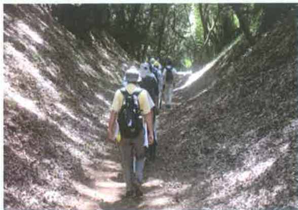
小峯御鐘ノ台大堀切東堀を歩く