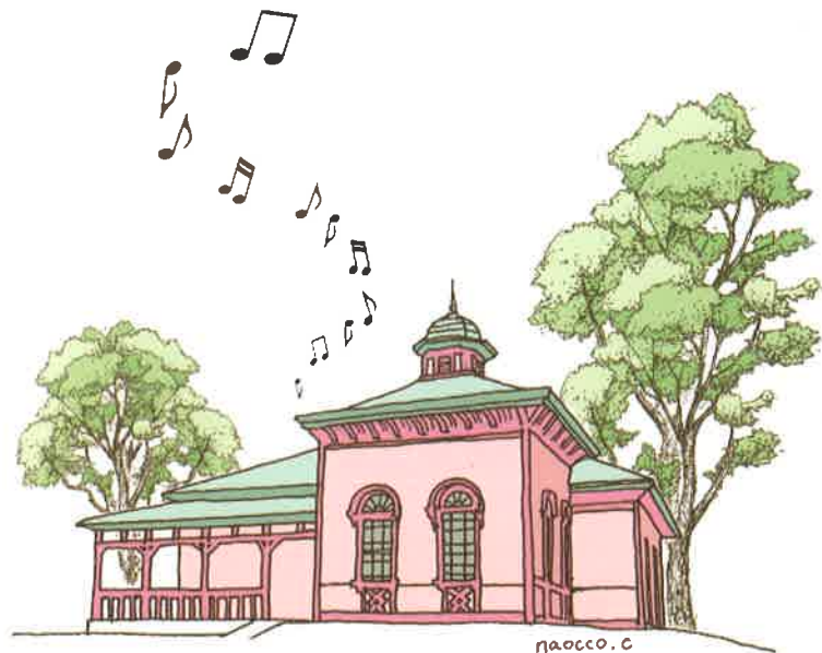
国登録有形文化財(建造物)