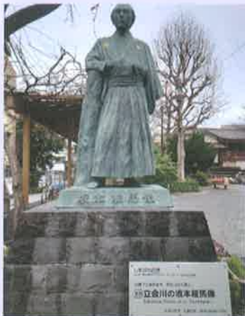
立会川の「20歳の坂本龍馬像」

—江戸時代以前からあった寺社や地形を見ながら、 20歳の坂本龍馬が見た時代を振り返ろう—