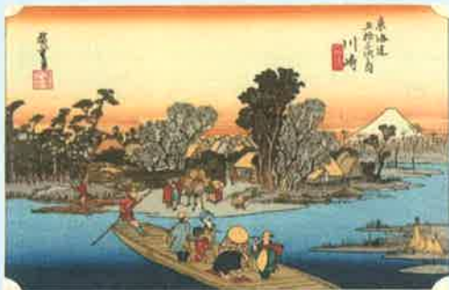
広重「東海道五十三次 川崎 六郷渡舟」

六郷川を渡り川崎宿に入ると、弘法大師への道と刻まれた道標があり、東海道から別れ、川崎大師に向かう大師道があります。