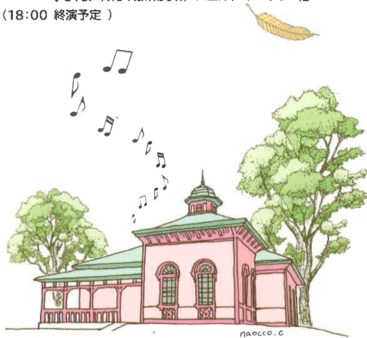
国登録有形文化財(建造物)