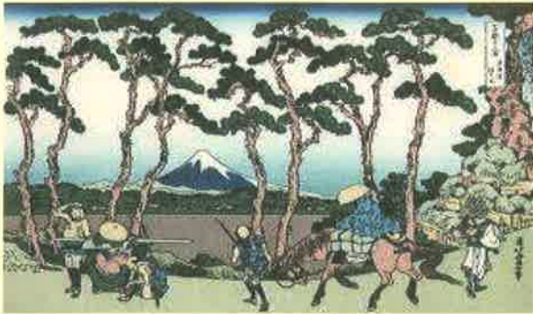
葛飾北斎 富嶽三十六景 東海道程ヶ谷

門前に置かれた2つの大きな鉄釜や仏足石が出迎える香象院、北条政子が化粧に使った井戸、十返舎一九の弟子五返舎半九が眠る福聚寺、縄文時代から人が住んでいた瀬戸ヶ谷地区にある瀬戸ヶ谷八幡社などを経て富士山を遠望しながら権太坂を上ります。坂を上ると今も昔も美味しい和菓子が待っています。