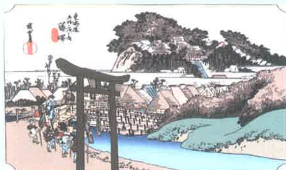
歌川広重「東海道五拾三次之内 藤沢 遊行寺」

藤沢駅から遊行寺を巡り、江戸時代と同じ道筋の藤沢宿を歩き、義経伝説を学び、最後に、明治時代に生まれ昭和の政財界をリードした吉田茂、味の素創業者・鈴木三郎助を排出した耕余塾までをウォークします。(約6.8 km)