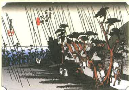
歌川広重「東海道五拾三次之内 大磯 虎ケ雨」

大磯駅を出発して、混血孤児を養育したエリザベス・サンダース・ホーム、『曾我物語』の虎御前ゆかりのお寺（延台寺）、西行法師ゆかりの場所（鳴立庵）、旧島崎藤村邸、旧宿場内から松並木を通り、明治記念大磯邸園まで歩きます。明治記念大磯邸園では、昨年11月から公開となった旧大隈重信別邸と陸奥宗光別邸跡の建物内部もご案内します。（半日コース、約4.2 km）